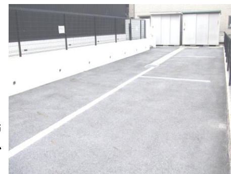
駐車場 P 3 台