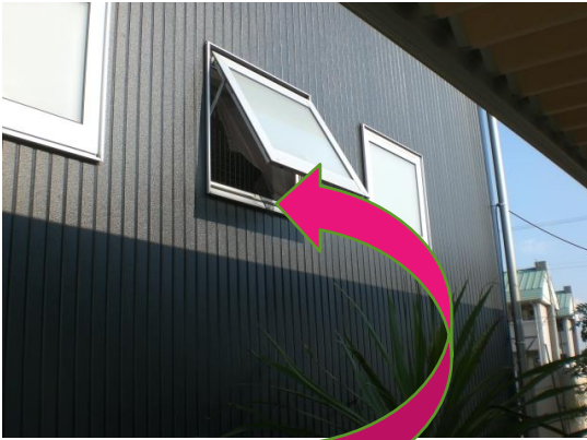
屋外 押し出し窓まで1.5M