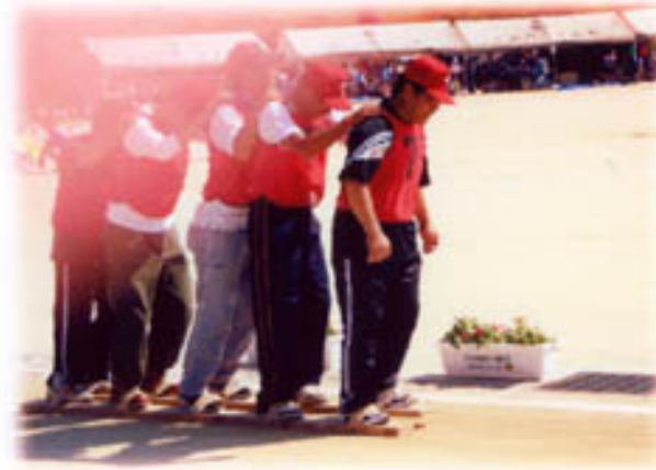
障害物リレー よ〜し ゴール目指していくぞ!