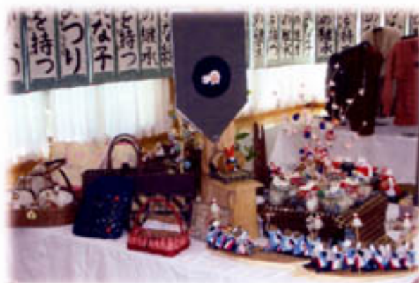
<手芸：ポプリクラブ>