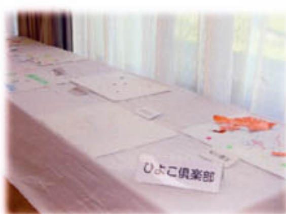
<絵画：ひよこ倶楽部>