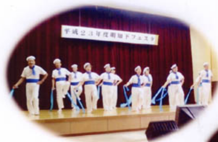
踊り：夢クラブ 曲名：港町13番地