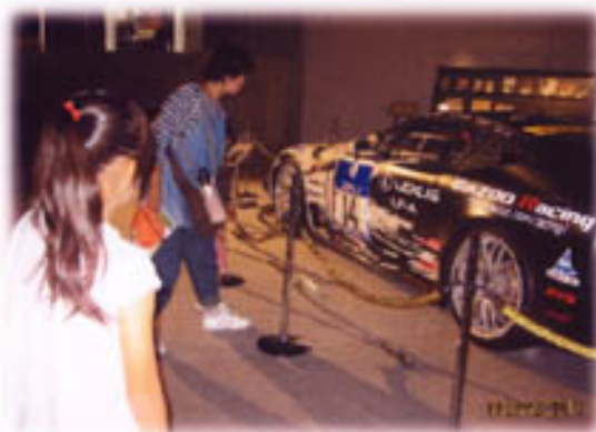
鞍ヶ池記念館内を見学中。