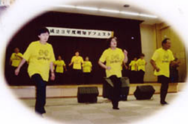
ピンコロ体操：夢クラブ 曲名：ピンコロ音頭、血液ガタガタ