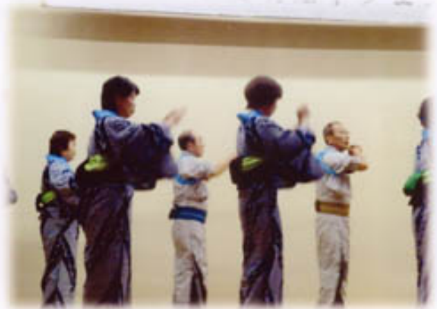
皆さん気合いが入ってます。