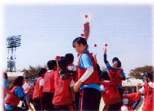
そこのあなた チョット 応援してくれないかしら?