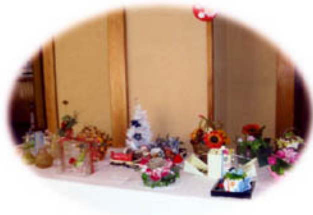
<生花・アレンジメント：草月流の皆さん>