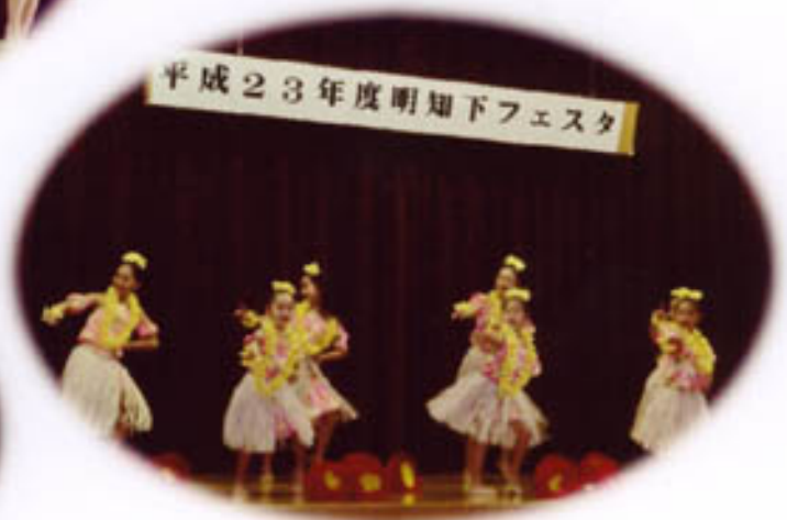
曲名 「ピニピニ」 「ポマイ」 「ハレアラカ」