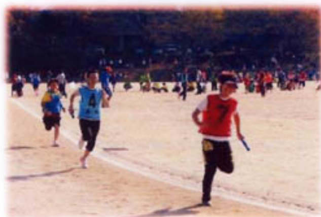
年齢別リレー 只今、トップを激走中!