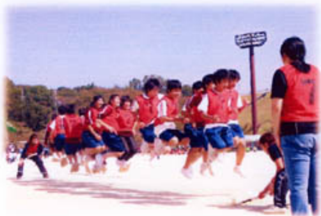
大なわとび 30回を超える成績、お見事!

総合3位!! 出場選手の皆さんの頑張りに感激です。 出場選手、応援に駆けつけた皆さん、体育委員をはじめ参加準備に携わった皆さん、大変、お疲れ様でした。