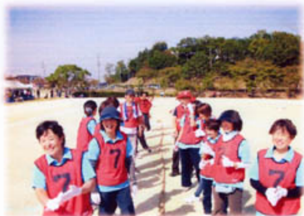
綱引き なでしこのみなさん? まだまだ 余裕です。