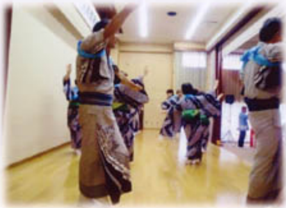
踊り：夢クラブ 曲名：龍馬おどり