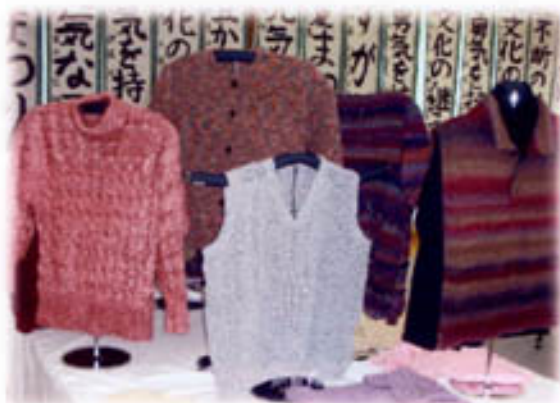
<手芸：編み物クラブ>