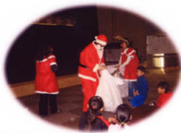
サンタさんから？ クリスマスプレゼントです。