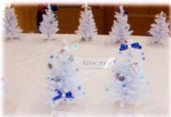
<クリスマスリース ：たけのこクラブ>