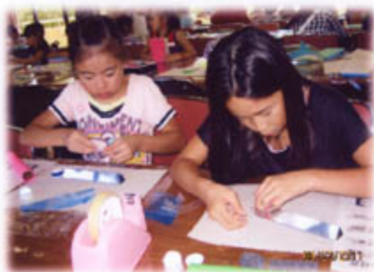
こども美術館でポリウレタンの作品を製作中。 何ができるのかな？