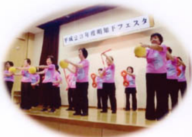
3B体操：365歩のマーチ はつらつの会