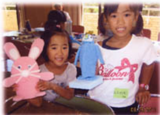
可愛いうさぎとペンギンが 出来ました。