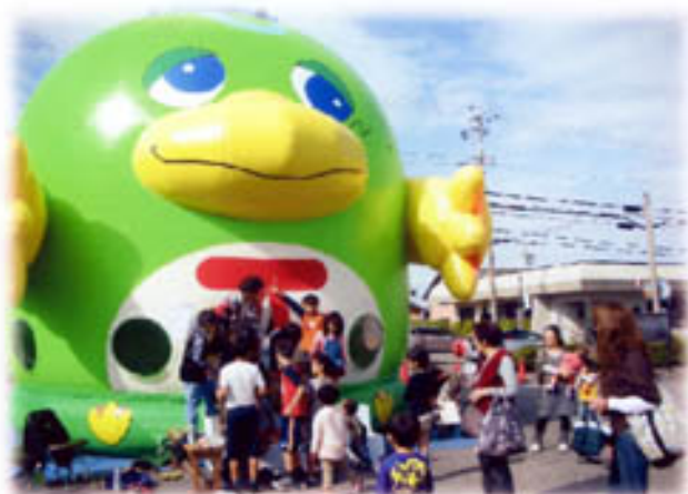
フワフワ 中は楽しいかい！