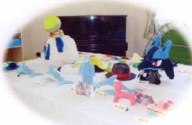
子どもたちの力作も展示されました。