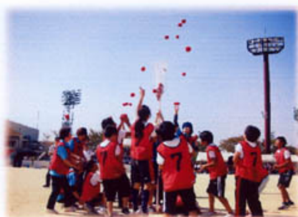
玉入れ 竹籠は? 白い網袋へ投げ込め!