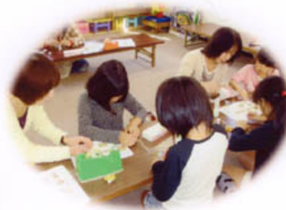
みんな 工作に夢中。