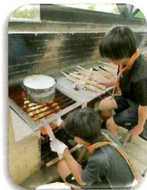
キャンプでごはん