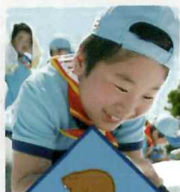
ビーバースカウト 小学1年生から

年代別のプログラムは、バラエティに富んでいて、学校では学べないことを体験できます。研修を受けた指導者達がボランティアで活動をサポートしています。