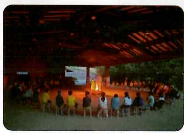
場所：豊田市野外活動センター