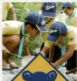
カブスカウト 小学3年生から