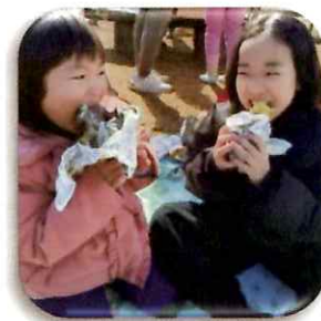
イモほり 冬には焼き芋

家族では体験できないような活動も多く、親子共々楽しく参加しています。違う学校のお友達ができるのも良いと思います