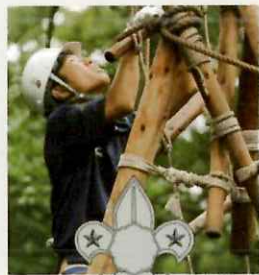
ベンチャースカウト 高校1年生から