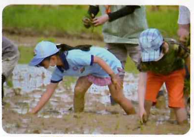
場所：三好丘駅近く