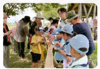
場所：さんさんの郷