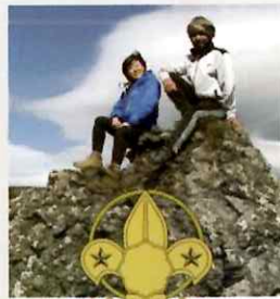
ローバースカウト 18才から

みよし第2団は市内・近隣で活動しています。年長さんからいつでも体験できます。ご連絡お待ちしております♪