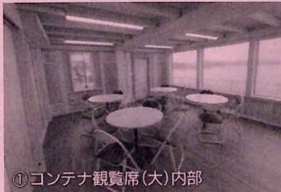
①コンテナ観覧席(大)内部