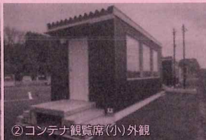
②コンテナ観覧席(小)外観