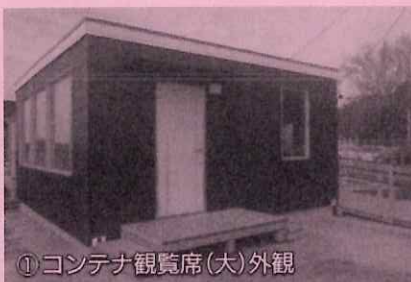
①コンテナ観覧席(大)外観