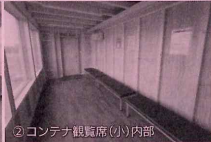
②コンテナ観覧席(小)内部